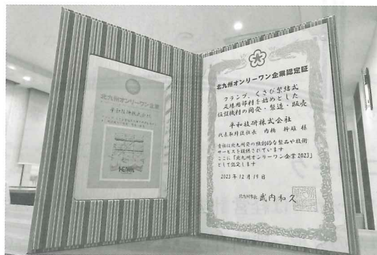
北九州オンリーワン企業認定証

ワン企業」として表彰を受けた。今後も「より良い製品、より良い価格提供、より良いサービス」を念頭に置きつつ、掲げた経営理念に基づき、地元北九州市への地域貢献も積極的に進める当社から目が離せない。