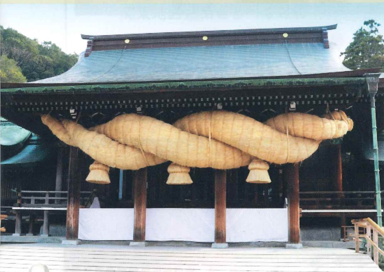
宮地嶽神社 大しめ縄